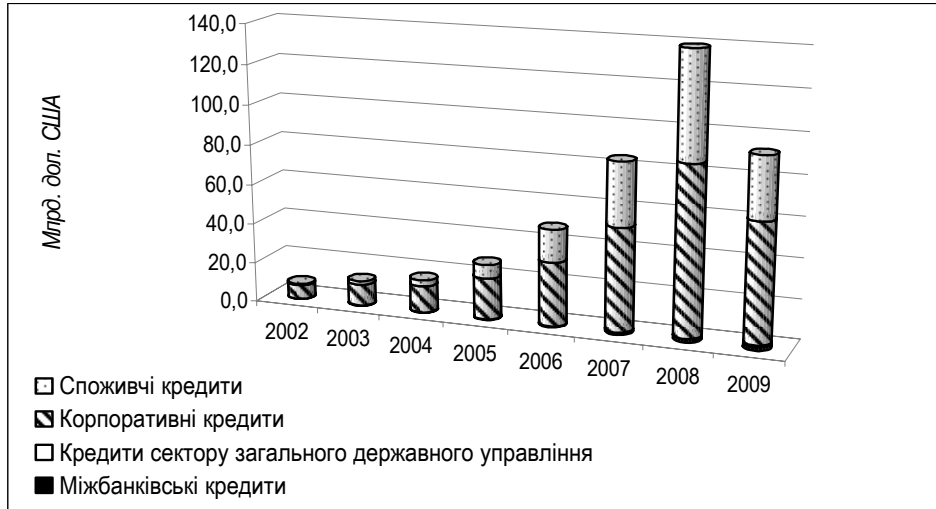
Рис. 1. Динаміка кредитно-інвестиційного портфеля вітчизняних банків у 2002–2009 рр. 2

Підтвердження наведеній тезі знаходимо в динаміці структурних передумов розвитку конкуренції в економіці України 2001–2009 рр. (табл. 2). Досліджуваний період відображає менш стрімке, порівняно з кредитною емісією, втім монотонне зростання конкурентного сектору та, відповідно, зниження монопольного сектору в економіці України, порушене, щоправда, наприкінці 2008 р. та у 2009 р. внаслідок кризових явищ, у тому числі й у банківському секторі. На особливу увагу при цьому заслуговує стрімке зростання олігопольного сектору з 11,6 до 16,6%. На відміну від "чистої" монополії та "досконалої конкуренції" – ринкових структур, що заперечують стратегічний характер конкуренції, її динамічну природу та творчу основу, саме олігополія формує передумову для "інтелектуального зростання суспільства" [7, с. 51]. Конкуренція тут проявляється у своїй найефективнішій поведінковій формі, сприяє формуванню зовнішнього позитивного ефекту для суспільства в цілому та кожного окремого споживача.