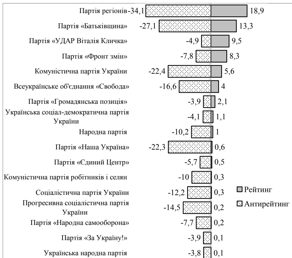
Рис. 4. Порівняння показників підтримки (рейтингу) та антирейтингу основних політичних сил

Рейтинг переважної більшості політичних сил не перевищує показників антирейтингу (за партію ніколи б не проголосували) (див. рис. 4). Лише політичні сили В. Кличка та А. Яценюка в березні 2012 р. мали позитивний баланс – кількісний показник їх прибічників був більшим за кількість тих, хто не голосував би за них за жодних обставин.