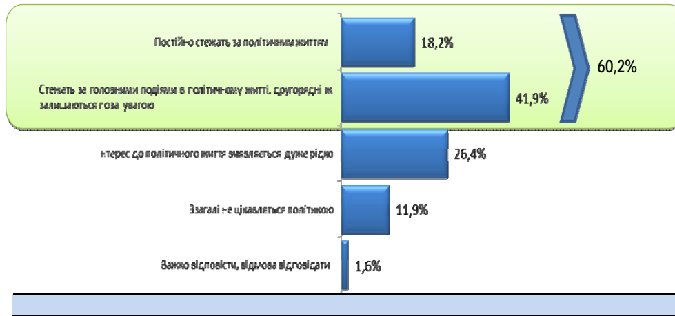
Рис. 1. Розподіл відповідей на запитання: "Якою мірою Ви цікавитесь політичними процесами, що відбуваються в Україні?", %