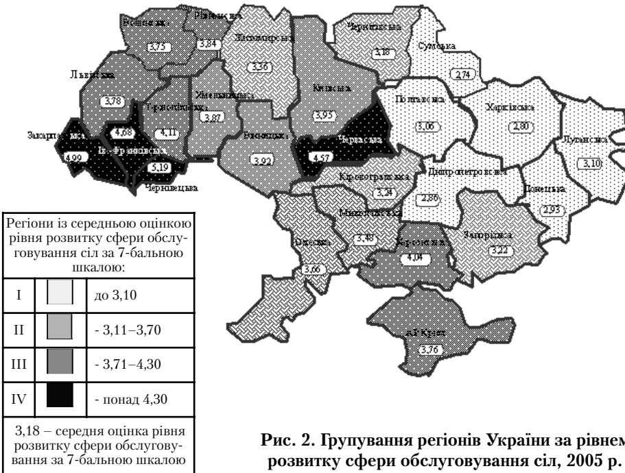
Рис. 2. Групування регіонів України за рівнем розвитку сфери обслуговування сіл, 2005 р.

Аналогічні показники, розраховані для кожного регіону, показують, що у 2005 р. різниця між найвищим їх значенням у Чернівецькій області (5,19) та найнижчим у Сумській (2,74) досягала 1,9 разу. В зазначеному діапазоні виділяються чотири групи регіонів, які мають доволі визначену географічну "прив'язку". Першу групу, з низькими (до 3,10) значеннями показника середньої оцінки розвитку сфери обслуговування сіл, утворюють компактно розташовані 6 областей північно-східної частини України – Сумська, Полтавська, Харківська, Дніпропетровська, Донецька, Луганська. До наступної, із середніми (найбільш наближеними до середнього по Україні) значеннями цього показника в діапазоні 3,11–3,70 входять дві північних – Чернігівська і Житомирська – та чотири південних – Одеська, Миколаївська, Запорізька і Кіровоградська області. Третя група регіонів, із значенням середньої оцінки в межах 3,71–4,30, представлена суцільною смугою із 7 областей, яка простягається від центру до західного кордону держави, а також двома найпівденнішими регіонами – Херсонською областю та АР Крим. І, нарешті, група з найвищими показниками, – це три південно-західних області – Закарпатська, Івано-Франківська та Чернівецька, а також центральна Черкаська область, рис. 2.