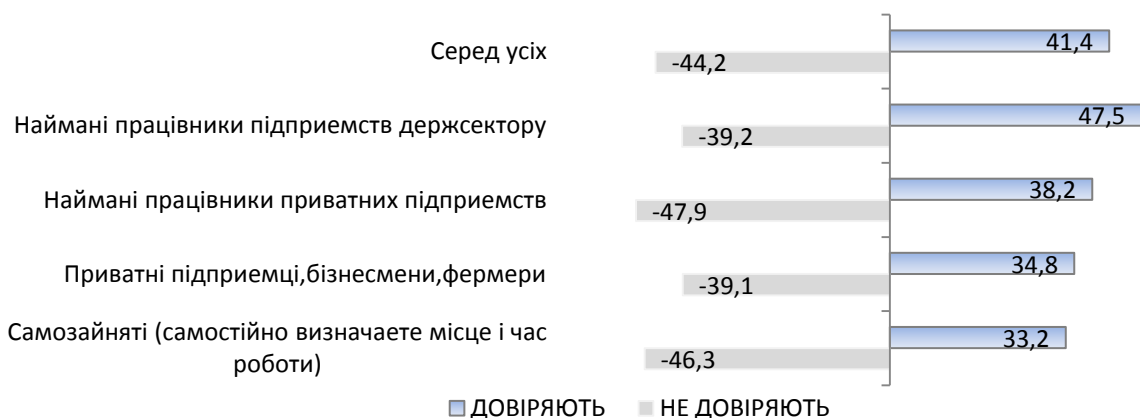
Рис. 2. Розподіл відповідей респондентів на запитання: «Якою мірою Ви довіряєте профспілкам?», %