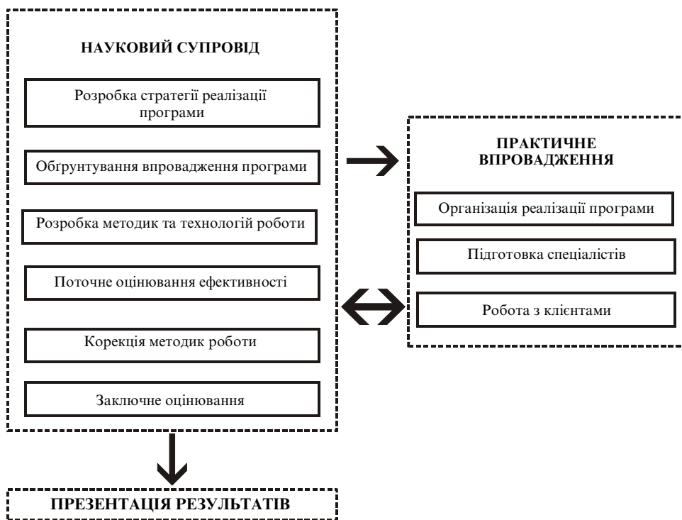
Рис. 5. Схема практичного впровадження соціальної програми

Аналіз соціального експерименту щодо створення прийомних сімей дозволив розробити схему реалізації соціальної програми спрямованої на практичну соціальну допомогу клієнтам (див. рис. 5).