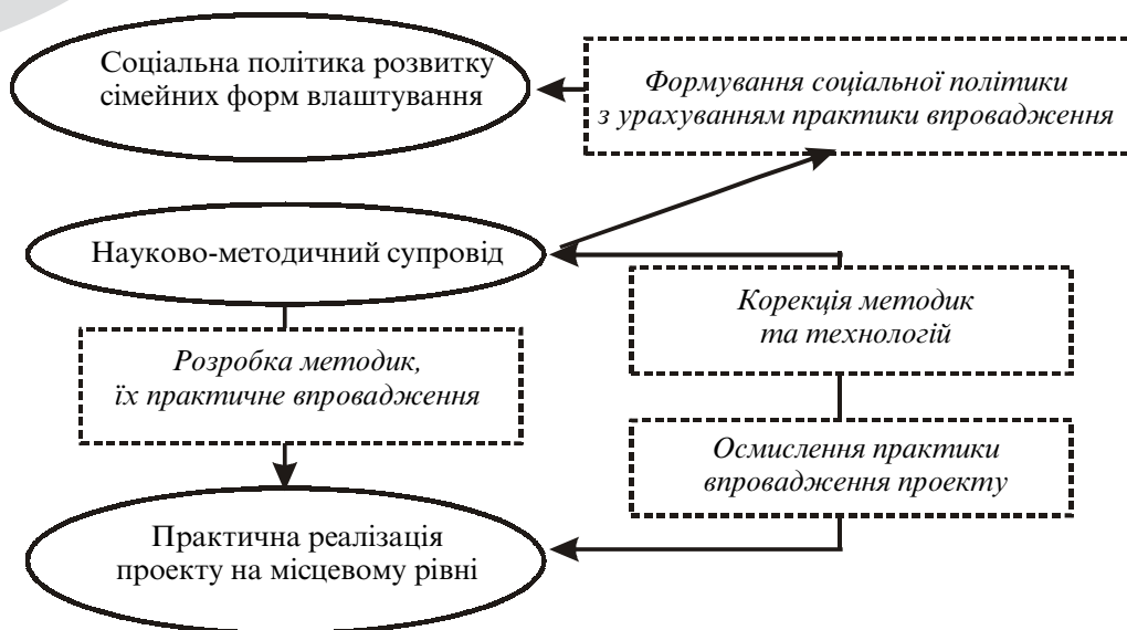
Рис. 2. Сфери впливу науково-методичного супроводу

та відділів (управлінь) у справах сім'ї та молоді. У свою чергу досвід практичного впровадження соціального експерименту використовувався при розробці нормативних та юридичних документів щодо функціонування прийомних сімей.