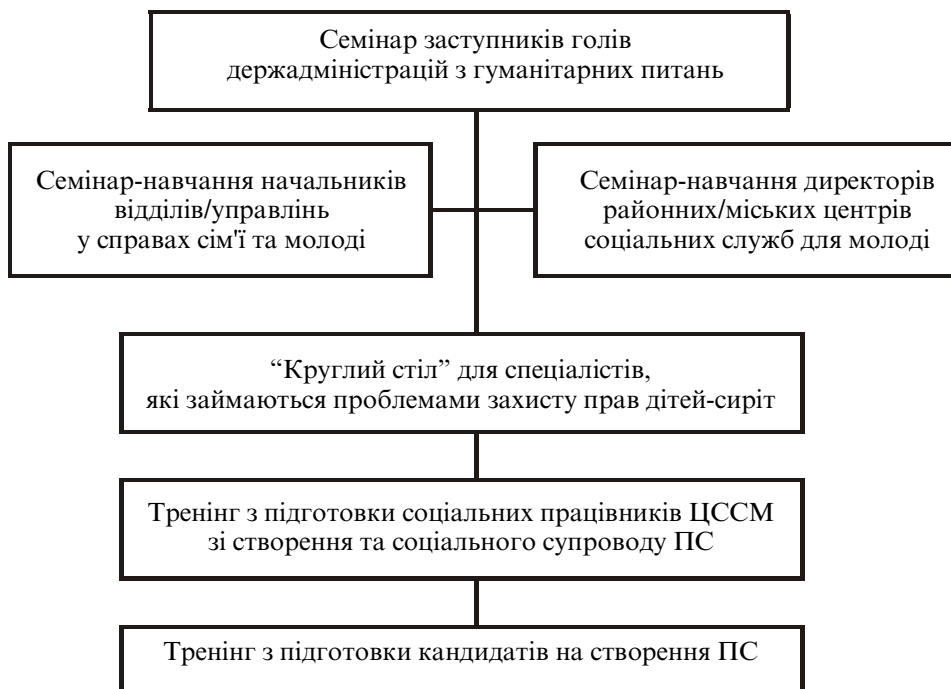
Рис. 4. Схема проведення навчально-інформаційних заходів при практичному впровадженні програми розвитку ПС

інститутом – прийомною сім'єю; роз'яснення переваги цієї форми влаштування дітей-сиріт та дітей, позбавлених батьківського піклування; юридичне підґрунтя та фінансове забезпечення існування прийомної сім'ї. У ході роботи розглядається реальна ситуація соціального сирітства в Україні, та причини, які зумовлюють необхідність трансформації існуючої системи утримання цих дітей.