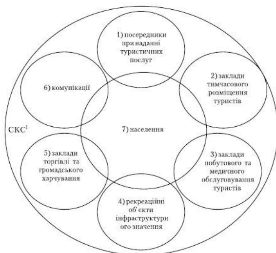
Рис. 2. Взаємодія елементів туристичної інфраструктури

Виклад основного матеріалу. Оскільки рекреаційний туризм є лише видом масового туризму [1, с. 273], то на нашу думку, доцільно було б не розмежовувати поняття «інфраструктура туризму» та «рекреаційна інфраструктура», а синтезувати сутність цих двох категорій в одну – «туристична інфраструктура». Отже представимо поелементний склад туристичної інфраструктури (рис. 2).