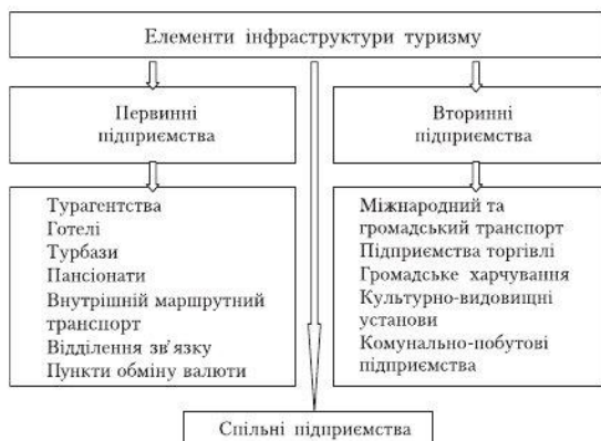
Рис. 1. Елементи інфраструктури туризму

Метою статті є розгляд поняття «туристична інфраструктура», його формулювання, визначення елементів, а також дослідження рівня забезпеченості об'єктами інфраструктури туристичної галузі Чернігівщини, аналіз динаміки реалізації туристичних послуг в області.