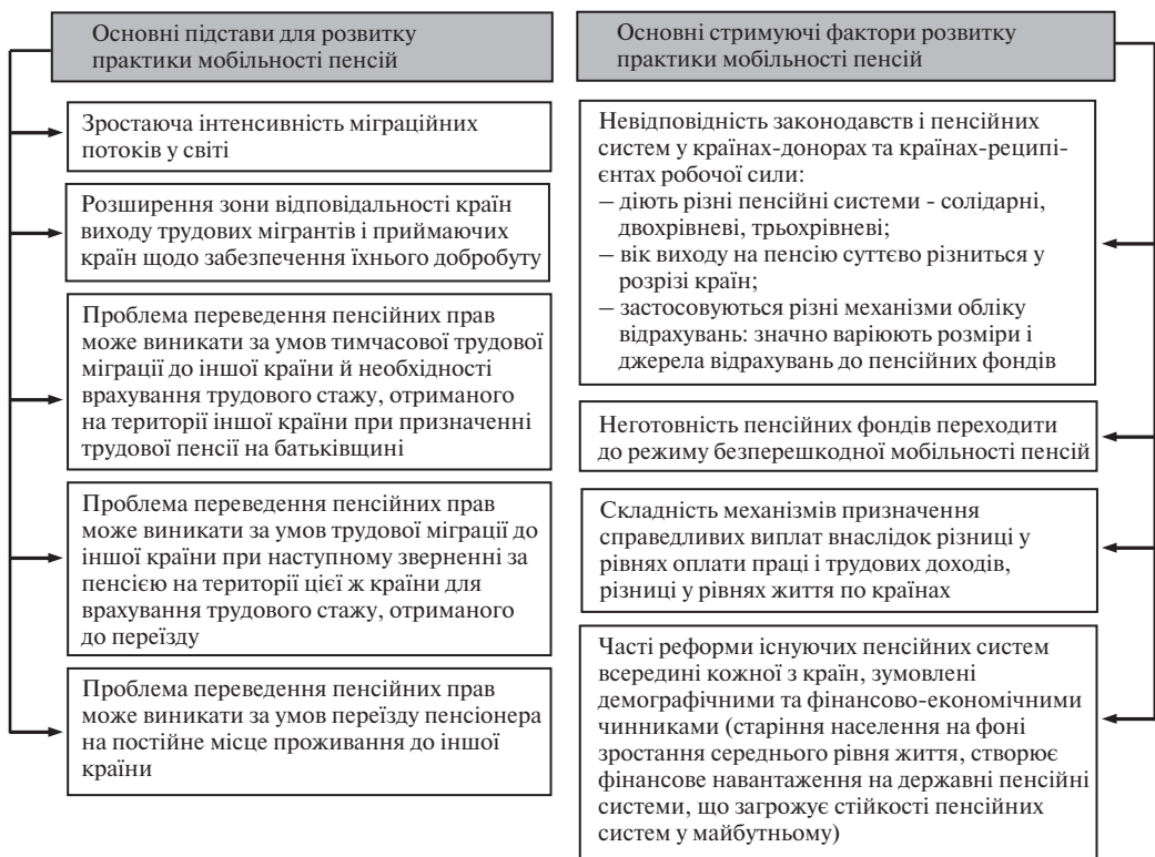
Рис. 3. Основні підстави та стримуючі фактори розвитку практики мобільності пенсій

Введення Законом України «Про загальнообов'язкове державне пенсійне страхування» нової страхової системи, яка синхронізується з нормами європейського законодавства в цій сфері, з одного боку, викликало необхідність переглянути вже діючі міжнародні угоди, а з іншого боку, відкрило можливості укладення міжнародних угод з іншими державами щодо здійснення пенсійного забезпечення сторонами за період сплати страхових внесків у кожній із держав-учасниць. Нині ведеться підготовча робота щодо укладання таких договорів з Угорщиною, Німеччиною, Румунією, Польщею, перегляду договорів з Іспанією та Естонією, а також Угоди про гарантії прав громадян – учасниць СНД в галузі пенсійного забезпечення від 13 березня 1992 р. Попри це, багато проблем залишаються невирішеними: угоди не покривають усіх видів соціального страхування; соціальні гарантії поширюються лише на легальних мігрантів, працевлаштованих у формальній економіці; існує багато стримуючих факторів розвитку практики мобільності пенсій (рис. 3).