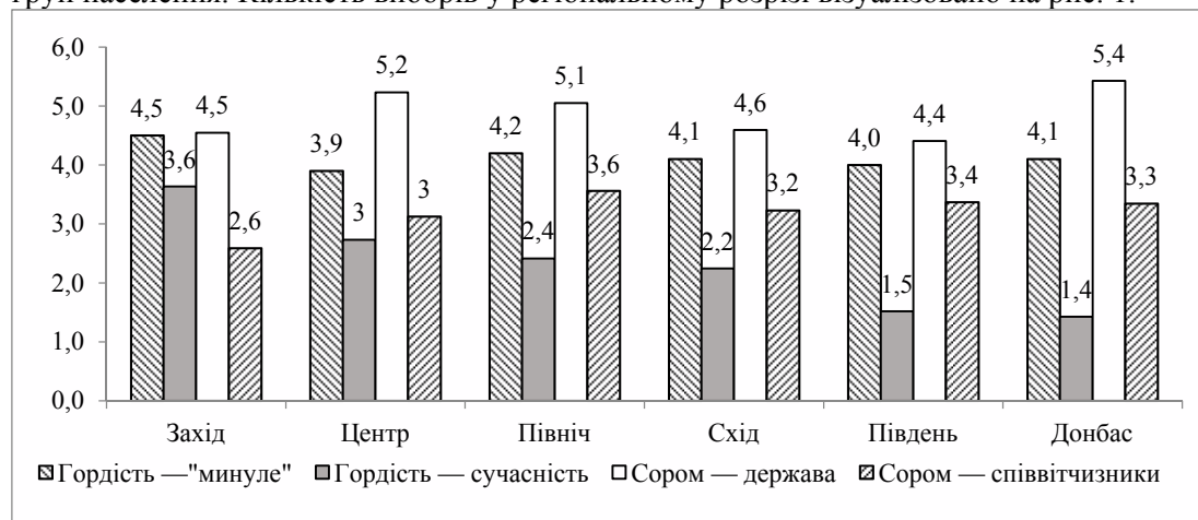
Рис. 1. Середня кількість виборів у запитаннях щодо почуттів гордості та сорому (регіональний розподіл)

Показник кількості зроблених виборів у запропонованих запитаннях щодо почуттів гордості та сорому також являє собою важливий матеріал для аналізу, адже респондента не було обмежено у кількості варіантів вибору, і саме число виборів є показовим. Так, найбільше варіантів було обрано серед того, що викликає сором у сучасній державі (в середньому 4,9), далі – гордість за минуле (4,2), потім – сором за співвітчизників (3,2), і найменша кількість виборів – серед того, що викликає гордість у сучасній державі (2,4). Кількість виборів у запитанні щодо сорому за державу більше ніж вдвічі перевищує кількість виборів того, що викликає гордість у сучасній Україні, – емоційно респонденти більше відгукуються на негатив і проблеми сучасного соціального життя, ніж на позитив та досягнення, і це співвідношення є характерним для всіх груп населення. Кількість виборів у регіональному розрізі візуалізовано на рис. 1.