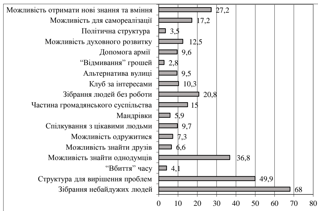
Рис. 2. Визначення громадської організації, на думку жителів Львова, %

Однак для аргументованого підтвердження цього теоретичне розуміння громадських організацій повинно узгоджуватися з певними особистісними чи практичними елементами людських уявлень. Одним з таких особистісних уявлень, на нашу думку, може бути розуміння респондентами того, чим саме для них є громадська організація (рис. 2).