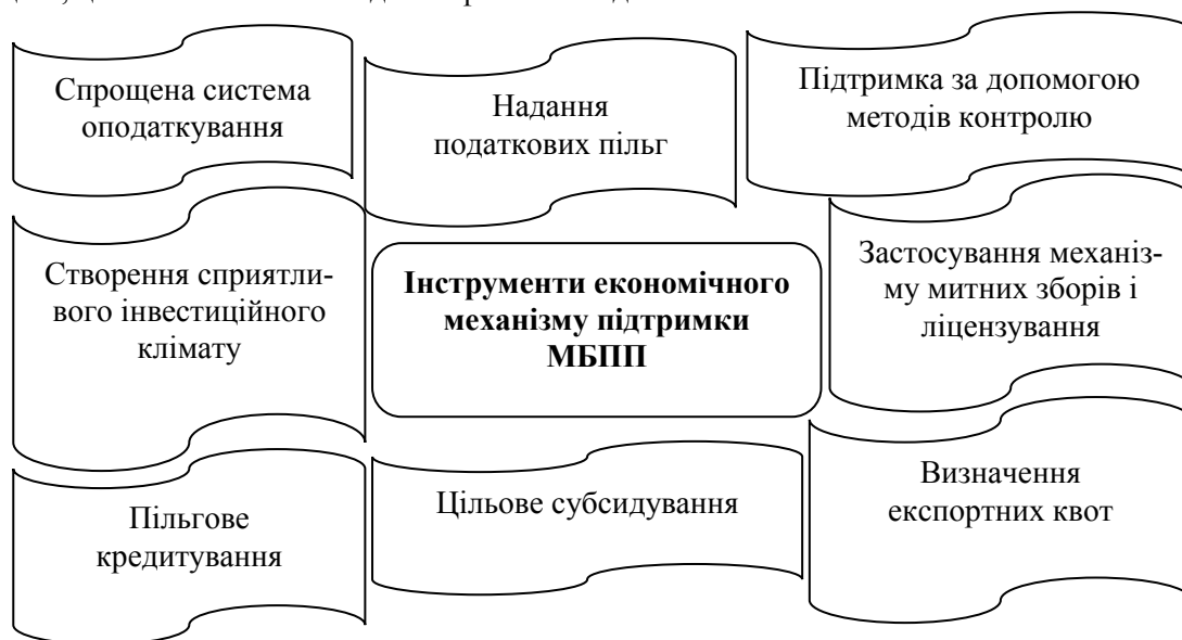
Рис. 2. Інструменти економічного механізму підтримки МБПП з боку держави

Для впровадження інструментів економічного механізму підтримки МБПП з боку держави (рис. 2) необхідно визначити організаційну структуру суб'єктів підприємництва, цілі та можливості надання фінансової допомоги.