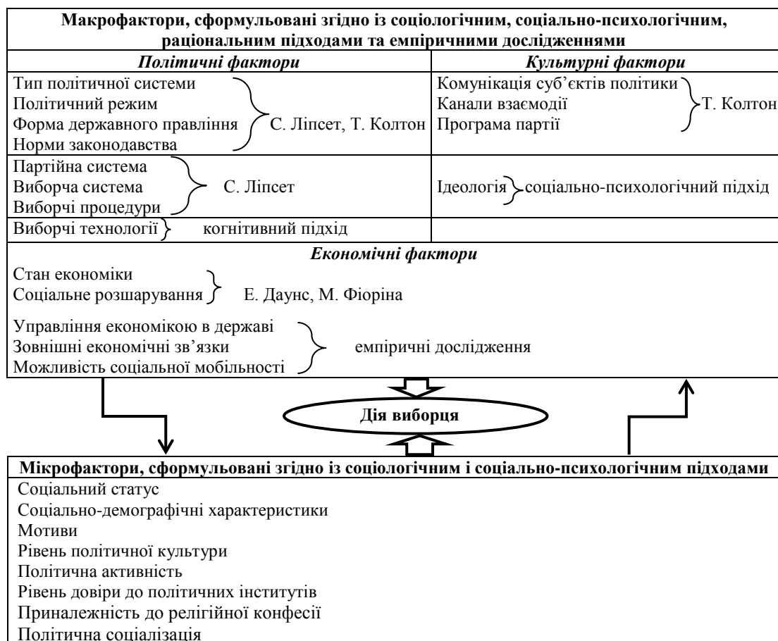
Рис. 2. Соціологічне моделювання факторів електоральної поведінки у рамках теорії дуалізму М. Арчер

Запропонований перелік факторів не є універсальною селекцією, але слугує методикою, яку можна застосовувати для розробки дизайну емпіричних досліджень, надійності вихідних методологічних позицій, вироблення програми емпіричних досліджень і перевірки закладених в них робочих гіпотез. Фактори кожної з груп можна доповнювати чи змінювати. Отже, враховуючи все зазначене, наводимо авторську концептуальну модель дослідження через синтез макрофакторів і дій агента (рис. 2).