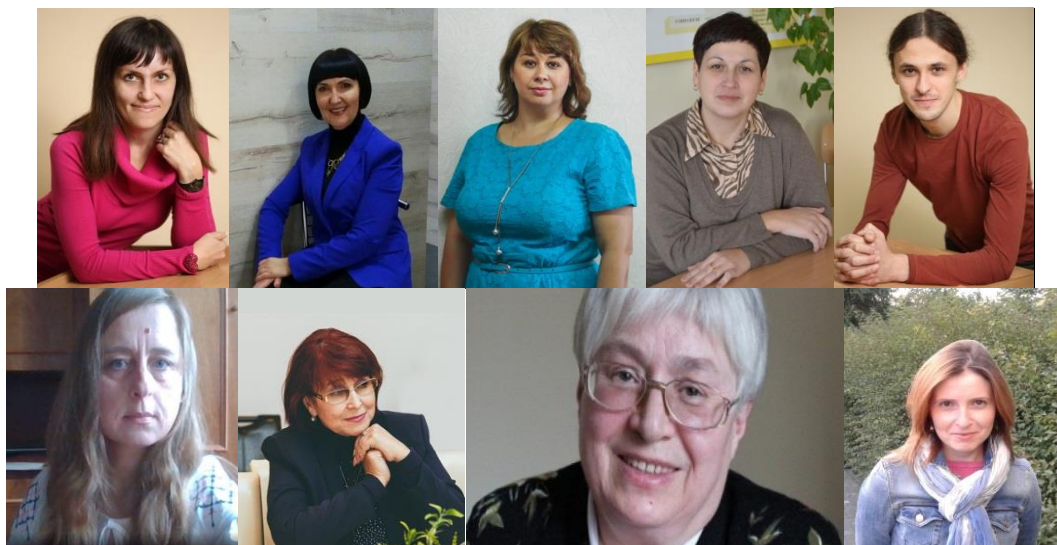
Керівники фіналістів конкурсу

Проведення Всеукраїнських конкурсів студентських наукових робіт стало традиційною формою огляду та відбору представників талановитої молоді, які мають інтерес до наукової діяльності й прагнуть знайти своє місце в науковому середовищі.