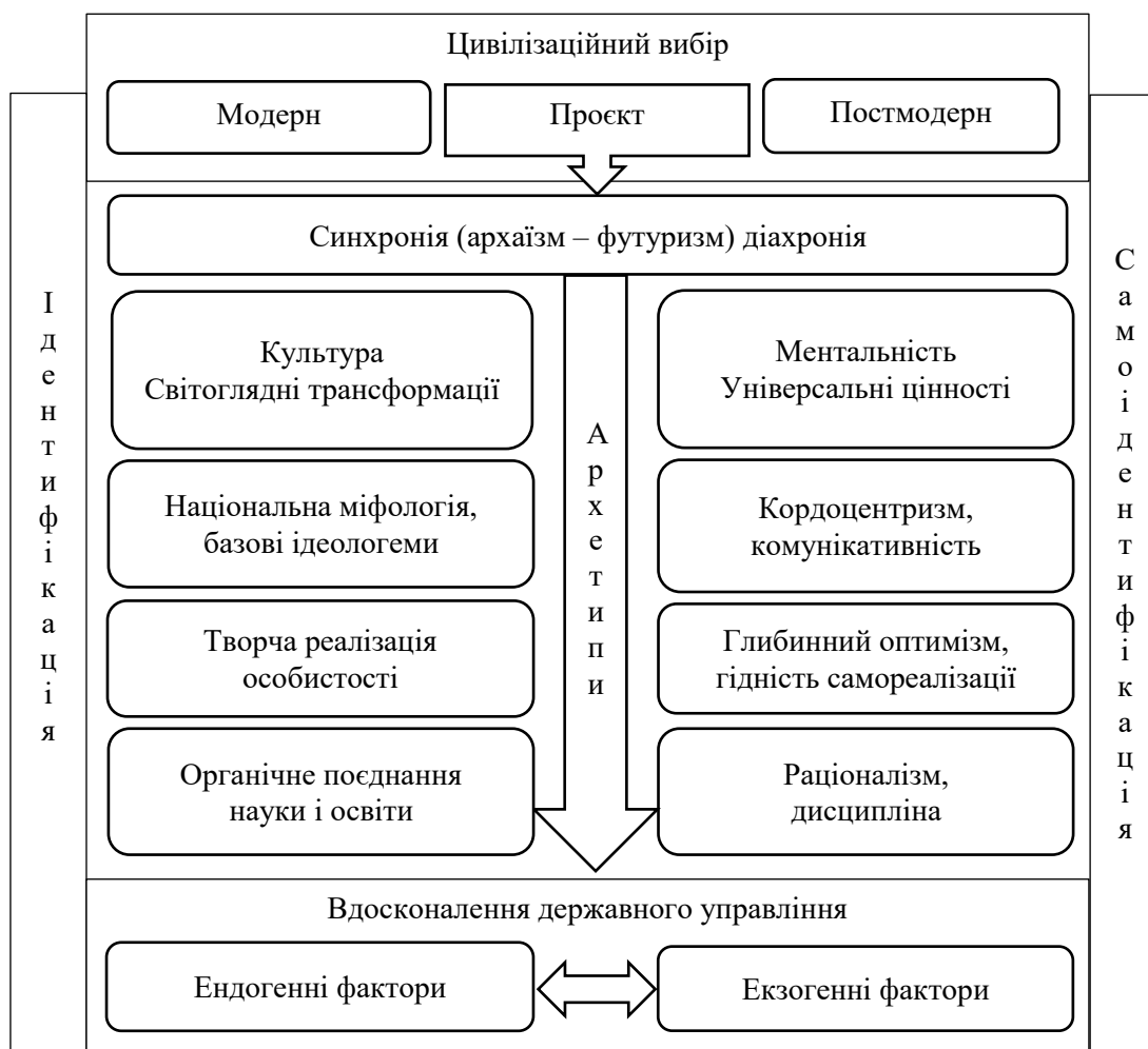
Рис. 1. Загальна схема ідентифікаційної підтримки управлінського процесу на основі залучення чільних цивілізаційних архетипів

перспектив, проблем і небезпек цивілізаційних запозичень, а також з'ясування механізмів, алгоритмів, закономірностей і особливостей впливу цивілізаційних архетипів на суспільства в синхронічному й діахронічному вимірі, без чого стає неможливим креативне узагальнення стратегій і футурологічних сценаріїв досконалого управління майбутнім розвитком України [16, с. 7, 122, 142, 145, 177, 201–235, 255]. Розроблену на згаданих принципах цивілізаційного вибору України загальну схему (само)ідентифікаційної підтримки системи управління процесу на основі залучення чільних цивілізаційних архетипів показано на рис. 1.